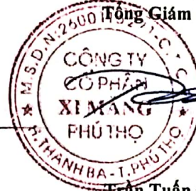
Trần Tuấn Đạt