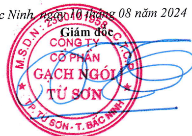
Trần Xuân Hùng