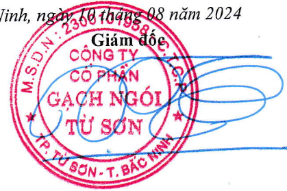
Trần Xuân Hùng