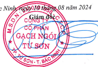
Trần Xuân Hùng