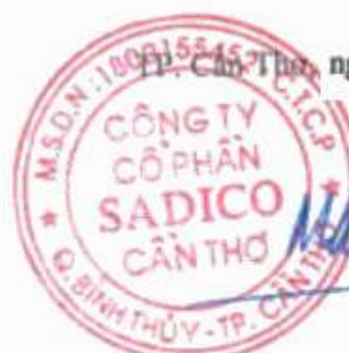
Mai Công Toàn Chủ tịch Hội đồng quản trị