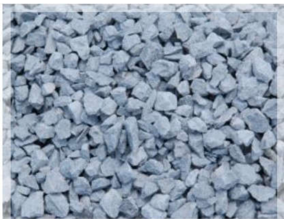
ĐÁ 1 X 2