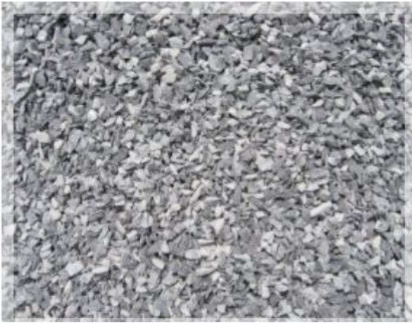
ĐÁ MI SÀNG (ĐÁ 3 X 8)