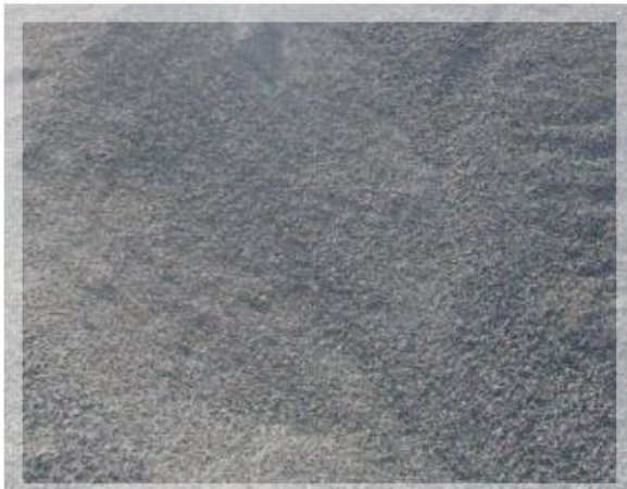
Đá Mi Bụi