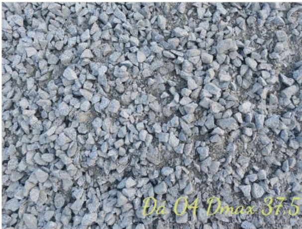
ĐÁ 0 x 4 dmax 37,5mm