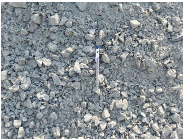
ĐÁ 0 x 4 dmax 25 mm