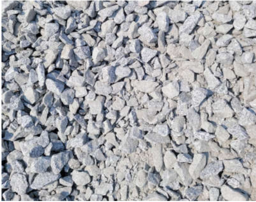
ĐÁ 0 x 4