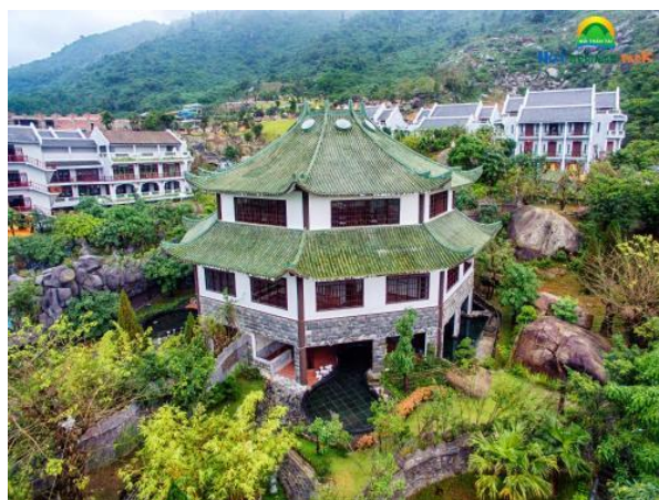
Khu khách sạn

Một số hình ảnh Công viên suối khoáng nóng Núi Thần Tài