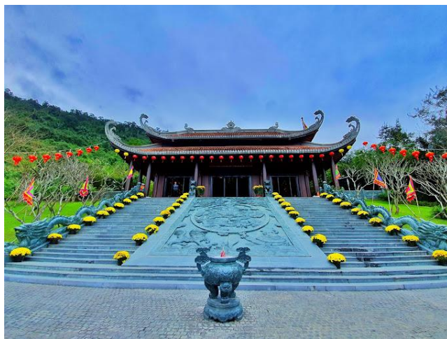
Đền thần tài