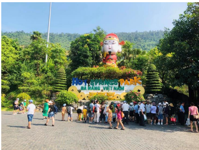
Công viên suối khoáng nóng Núi Thần Tài