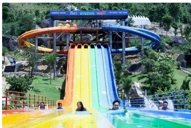
Công viên nước