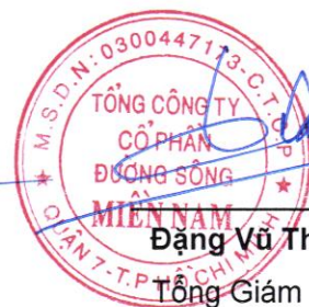
Đặng Vũ Thành