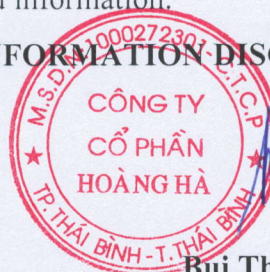
Bui Thi Tam