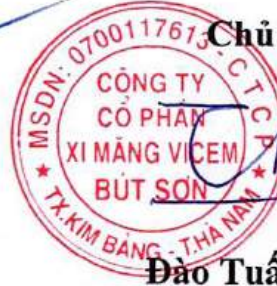
Đào Tuấn Khôi