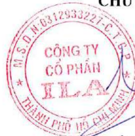
VÕ XUÂN PHONG