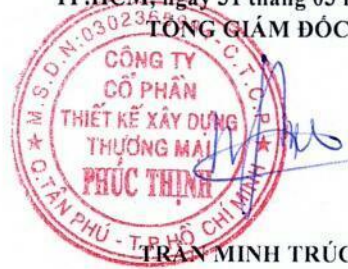
TRẦN MINH TRÚC