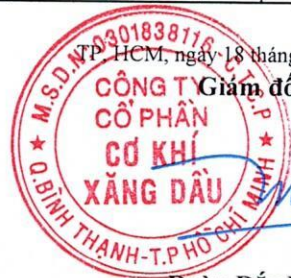
Đoàn Đắc Học