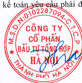
Tổng Giám đốc