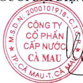
Chủ tịch Hội đồng quản trị Hồ Tấn Luật