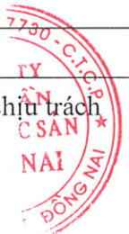
Trương Tấn Cường