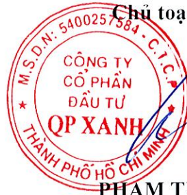
PHẠM TỰ TRỌNG