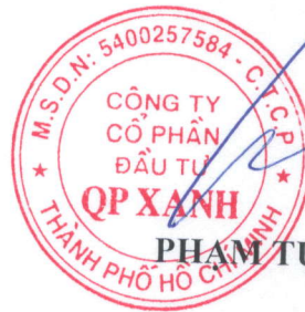
PHẠM TỰ TRỌNG