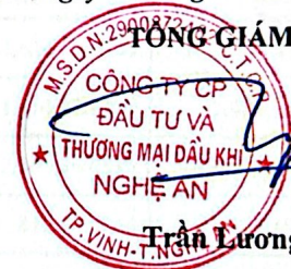
Trần Lương Sơn