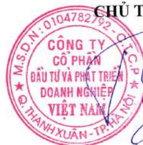
HÀ XUÂN TRƯỜNG