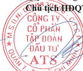
Trần Phúc Thiên Ân