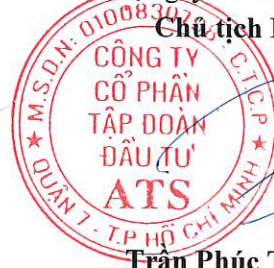
Trần Phúc Thiên Ân