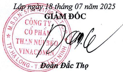
Đoàn Đức Thọ