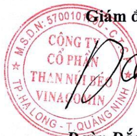
Đoàn Đức Thọ