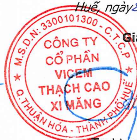
Trương Phú Cường