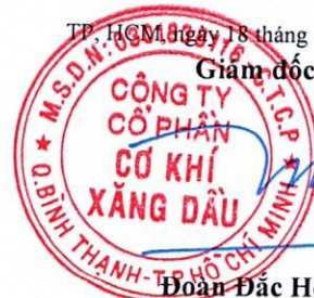
Đoàn Đặc Học