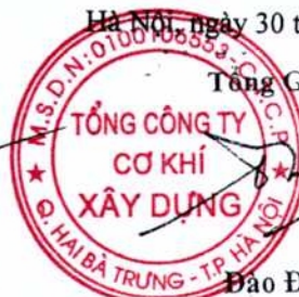
Đào Đức Thọ