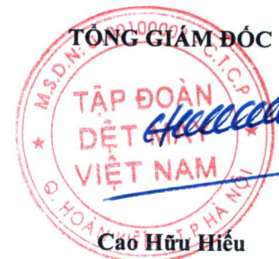
Cao Hữu Hiếu