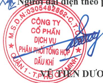
VŨ TIẾN DƯƠNG