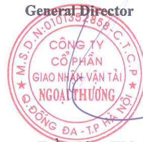
Trần Công Thành