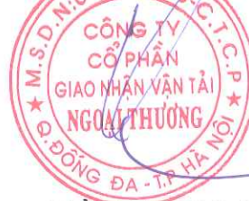
Trần Công Thành