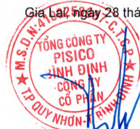
Đồng Thị Ánh Chủ tịch Hội đồng quản trị