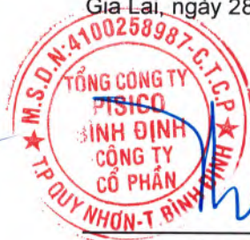
Đồng Thị Ánh Chủ tịch Hội đồng quản trị