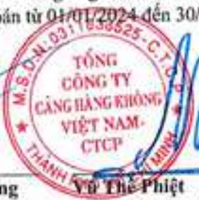
Vũ Thế Phiệt Chủ tịch Hội đồng quản trị Ngày 29 tháng 08 năm 2025