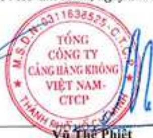
Vũ Thế Phiệt Chủ tịch Hội đồng quản trị