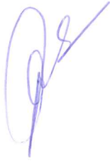
CÔNG TY CỔ PHẦN TRANSIMEX LOGISTICS