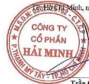
Trần Quang Tiến Chủ tịch HĐQT

Báo cáo này là bộ phận hợp thành của báo cáo tài chính và phải được đọc kèm với thuyết minh Báo cáo tài chính