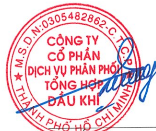
Vũ Tiên Dương Chủ tịch Hội đồng quản trị