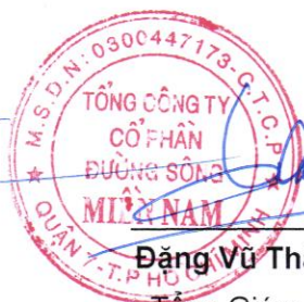
Đặng Vũ Thành