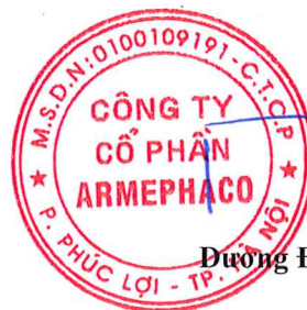
Đường Đình Sơn