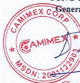
Đặng Ngọc Sơn