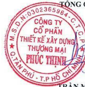
TRẦN MINH TRÚC