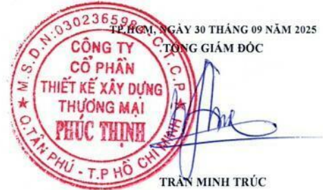
TRẦN MINH TRÚC