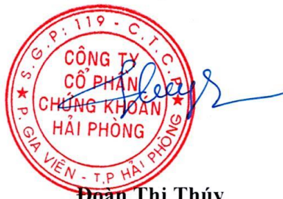
Đoàn Thị Thúy

(Signature, full name, position, and seal)