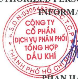
PHAN HAI AU

AUTHORIZED PERSON TO DISCLOSE INFORMATION