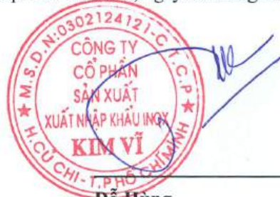
Đỗ Hùng Chủ tịch Hội Đồng Quản Trị