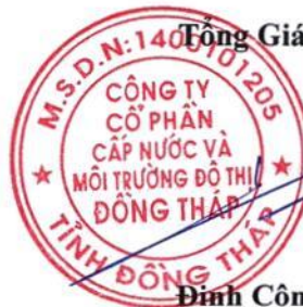
Đinh Công Phú