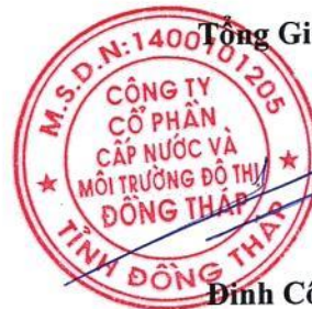
Đinh Công Phú