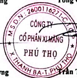
Trần Tuấn Đạt