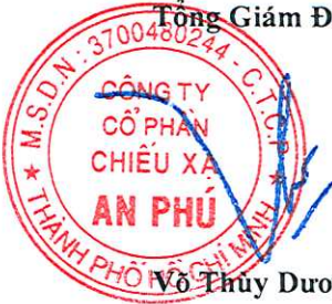
Võ Thủy Dương