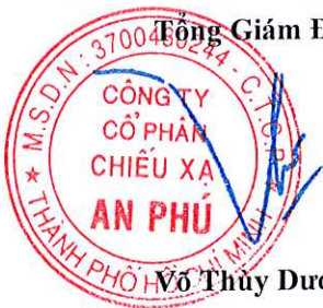
Võ Thủy Dương