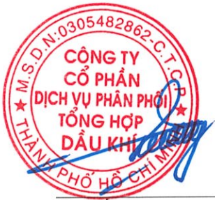
Vũ Tiên Dương Chủ tịch Hội đồng quản trị