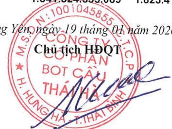
Ngô Tiến Cường