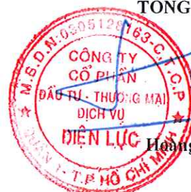
Hương Huy Hùng