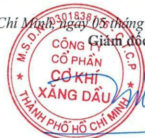
Đoàn Đắc Học