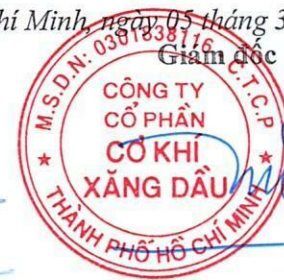
Đoàn Đắc Học