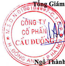
Ngô Thành An