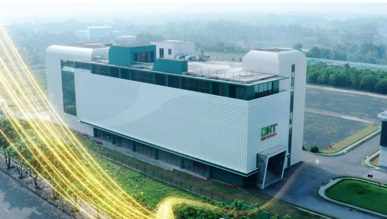
Nhà máy dược phẩm CNC Hataphar