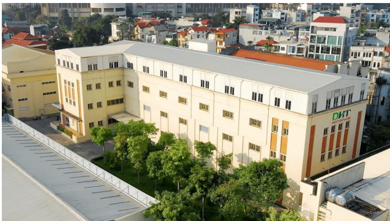
Nhà máy sản xuất tại La Khê