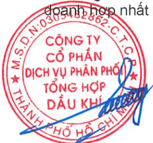
Vũ Tiến Dương Chủ tịch HĐQT

Người sử dụng báo cáo tài chính riêng của Công ty nên đọc cùng với báo cáo tài chính hợp nhất của Công ty và các công ty con (gọi chung là "Nhóm công ty") cho năm tài chính kết thúc ngày 31 tháng 12 năm 2025 để có đủ thông tin về tình hình tài chính hợp nhất, kết quả hoạt động kinh doanh hợp nhất và tình hình lưu chuyển tiền tệ hợp nhất của Nhóm công ty.