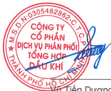
Vũ Tiến Dương Chủ tịch HĐQT Ngày 24 tháng 3 năm 2026

Các thuyết minh từ trang 9 đến trang 42 là một phần cấu thành báo cáo tài chính riêng này.