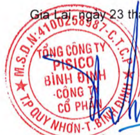
Đồng Thị Ánh Chủ tịch Hội đồng quản trị