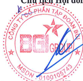
Hoàng Trọng Đức

(Các thuyết minh từ trang 10 đến trang 37 là bộ phận hợp thành của Báo cáo tài chính riêng này)